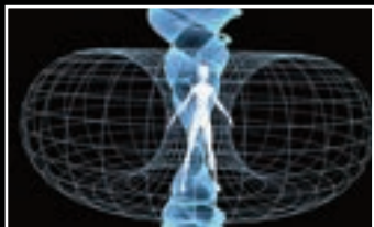
Guérir son âme avec le magnétisme